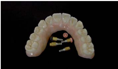
Die nur im Zahnfleischbereich verblenden- ten OK+UK - Prettaubridgen

Das Finish konnte beginnen. Die TK1-Friktionsgeschiebe wurden in die UK-Prettau Bridge eingebracht: Diese haben eine Friktionspassung und müssen nicht verklebt werden. So ist ein späteres Austauschen ohne großen Aufwand möglich. Die Ankermatrizen für die Locatoren im Oberkiefer wurden eingedrückt.